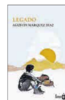
Legado Agustín Márquez Díaz La Navaja Suiza 15 €

En Legado hay espacio para la aflicción, la ironía y los recuerdos. Una novela que muestra cómo una situación tan dolorosa como el tránsito ineludible de un ser querido hacia su final puede servir de paliativo contra una enfermedad que no permite el descanso del que la padece. Porque sólo el legado puede ayudarnos a contrarrestar aspectos adversos de la inevitable herencia genética.