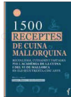
1500 receptes de cuina mallorquina Documenta, 43 euros

Recull de les 1.500 receptes recuperades, cuinades i tastades per l'Acadèmia de la Cuina i del Vi de Mallorca durant els seus 35 anys d'existència. Són receptes que configuren els plats autòctons, recuperades des de receptaris, manuscrits o impresos, llibres i fonts orals. Totes han estat cuinades i tastades per algunes de les gairebé 250 persones que han hi col·laborat.