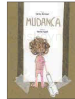
Mudança M. Bennàssari i M. Uguet Disset, 15 euros

Aquest llibre il·lustrat ofereix diferents lectures: una de lúdica, per gaudir amb els protagonistes del món fantàstic dels dinosaures tan popular en la infància; una d'empàtica, per connectar amb la inseguretat i la por que ens poden provocar els canvis (de domicili, d'escola, de classe...); i una de reflexiva, per qüestionar-nos el nostre bagatge cultural referent als estereotips de gènere.