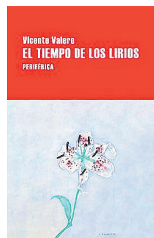
El tiempo de los lirios Vicente Valero Periférica 224 páginas, 19 euros