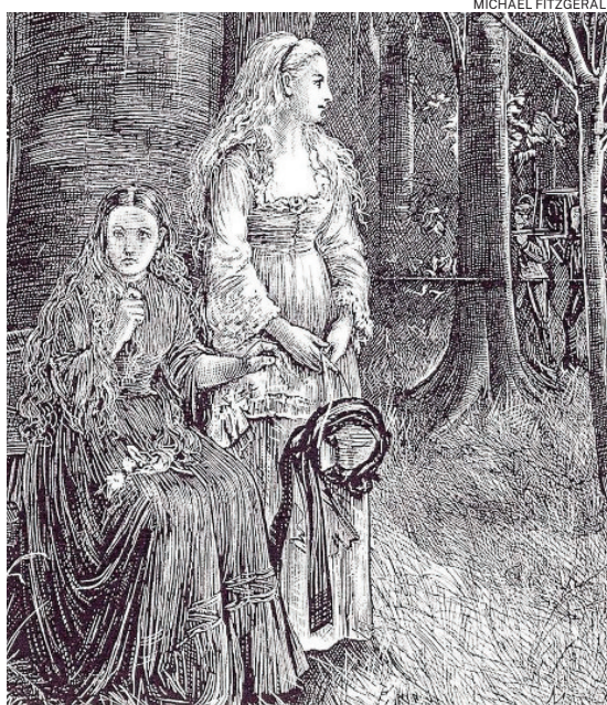
Una de las ilustraciones que acompañaron el texto de Le Fanu

Es cierto que este tipo de personajes siempre han sido una buena cortapisa para hablar de asuntos por lo general censurados o reprobados por la moral de la época, como son las enfermedades sexua-