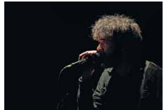
Gorka Urbizu en el último concierto en San Fermín.

Con cuatro nominaciones la canaria Valeria Castro compete en las categorías Premio Radio 3 a Canción del año, Premio AIE a Mejor Artista, Premio MIN a Mejor Letra Original y Premio MIN a Mejor Videoclip. Les siguen con tres nominaciones artistas como Zahara, Hinds, Vetusta Morla, Gorka Urbizu o Baiuca que fue el gran triunfador de la edición anterior.