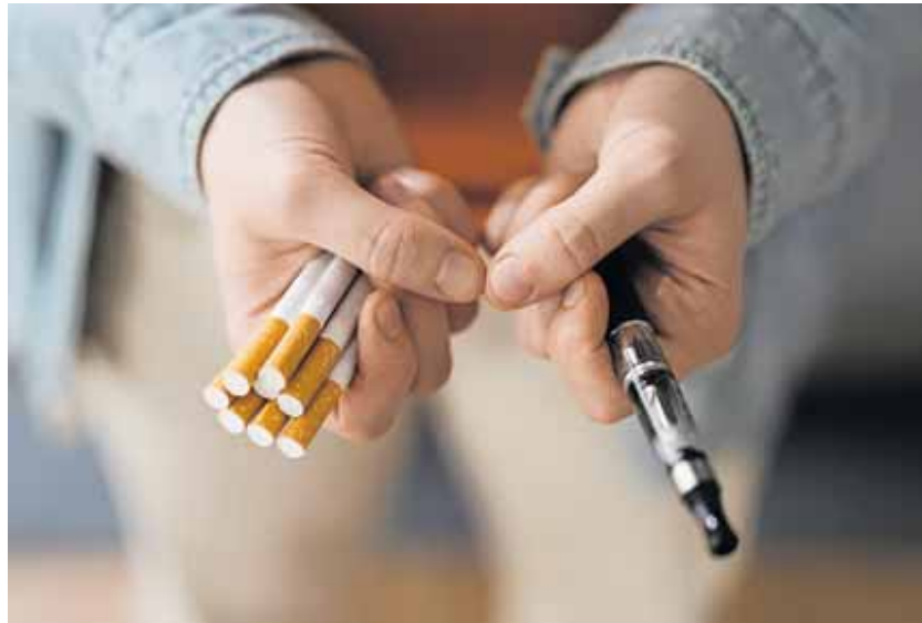
Un fumador, con cigarrillos electrónicos y un cigarrillo electrónico.

En Umbría y en otras partes. Creo que es fácil de vez en cuando tener ese sentimiento de que la cultura que pierde sus raíces espirituales desemboca en disparates. La verdadera cultura siempre ha tenido un fundamento espiritual, y no perderlo de vista es la única manera de que realmente sobreviva la cultura.